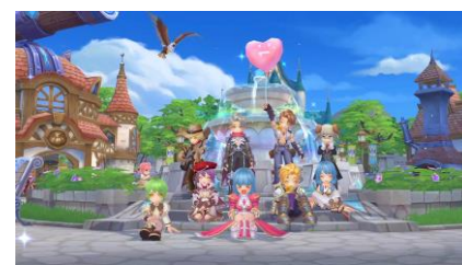
ゲーム画面イメージ①

『ラグナロクX』は、今なお世界各国で愛されMMORPGの歴史に輝く『ラグナロクオンライン(通称、RO)』のシリーズ最新作です。『RO』の特徴であるキャラクターや多彩な職業、アイテム・スキル・ステータスを組み合わせた「自由度の高いキャラクタービルド」を本作でも楽しむことができます。重厚なストーリークエストや、モンスターの強さ、収集などやり応えはシリーズ屈指！