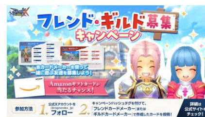
「フレンド・ギルド募集キャンペーン」 イメージ

『ラグナロクX』公式サイトにて展開している「フレンドカードメーカー」「ギルドカードメーカー」にて作成した「フレンドカード」「ギルドカード」の画像を各応募コースのキャンペーンハッシュタグをつけて投稿してください。投稿いただいた方の中から抽選で合計15名の方に、Amazonギフトカードをプレゼントいたします。キャンペーンに参加して友達を見つけ、一緒に新しい冒険にでかけましょう。