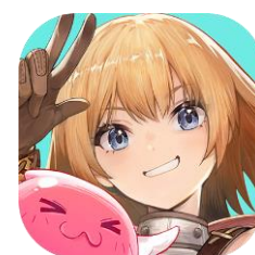
『ラグナロク X』アプリアイコン