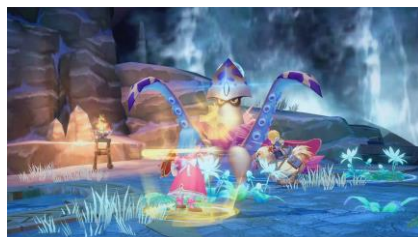
ゲーム画面イメージ②