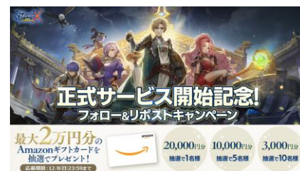
「正式サービス開始記念！ フォロー&リポストキャンペーン」イメージ

正式サービス開始を記念して、Xにてリポストキャンペーンを実施いたします。『ラグナロクX』の公式Xアカウント(@ragnarokx_jp)をフォローし、キャンペーンハッシュタグが入った対象のポストをリポストしてください。最大2万円分のAmazonギフトカードが抽選で16名様に当たります。まだ『ラグナロクX』公式Xアカウントをフォローしていない方は、この機会にフォローして、キャンペーンにご参加ください。