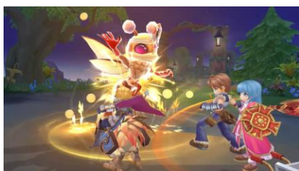
ゲーム画面イメージ①