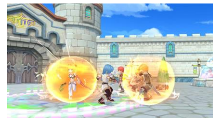
ゲーム画面イメージ③