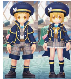
初心者ミッション 7日間報酬 「学園祭の制服セット」

計7日間のレッスン「初心者ミッション」やサイコロを使ってマスを進めていくと、さまざまなアイテムを報酬として獲得できる「王城すぐろく」など、ゲーム内イベントを多数ご用意いたしました。「初心者ミッション」では、毎日のレッスンを完了するとポイントがたまり、報酬を受け取ることができます。7日間、すべてのレッスンをクリアすると、アバターアイテム「学園祭の制服セット」を手に入れることができます。メインストーリーとあわせて、多種多様なイベントをお楽しみください。各イベントの詳細はゲーム内にてご確認ください。